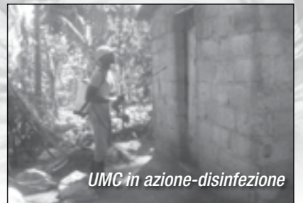
UMC in azione-disinfezione

Conclusi gli interventi MLFM atti a risolvere l'emergenza colera. Oltre al proseguimento dei lavori per la conclusione del progetto idrico di Les Cayes, sono infatti scattate da gennaio le misure integrative atte a tamponare l'attuale situazione di emergenza sanitaria dell'isola caraibica. In collaborazione con Terre Des Hommes (organizzazione non governativa per la difesa dei diritti dell'infanzia) è stata costituita l'Unità Mobile Colera (UMC), un'unità speciale di intervento che lavora full time per la lotta contro l'epidemia che da 4 mesi sta dilagando ad Haiti e che ad oggi ha già causato più di 5.000 vittime. Fondamentali per limitare il diffondersi di questa malattia sono il corretto utilizzo dell'acqua e il rispetto delle norme igienico sanitarie di base; è proprio la mancanza di latrine sia private che pubbliche il problema più grave da affrontare. Per questo motivo, oltre a disinfettare le abitazioni contaminate, MLFM e TDH svolgono attività di sensibilizzazione ed educazione in tema di acqua ed igiene. Per approfondimenti www.mlfm.it/progetti/altro