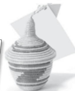
Bomboniere solidali: agaseke dal Rwanda

MLFM e il Laboratorio degli Archetipi sono lieti di invitarTi SABATO 25 GIUGNO, ORE 21 IN PIAZZA DELLA VITTORIA. LODI