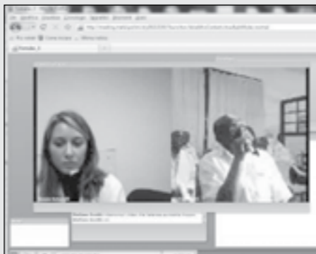
Videoconferenza tra l'Ospedale Fomulac e l'Ospedale San Raffaele

RISULTATI: Assistenza sanitaria aggiornata, precisa e puntuale.